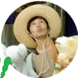
とうほう 東方 るい