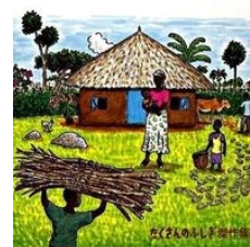
『エンザロ村のかまど』 さくまゆみこ(文) 沢田としき(絵) 福音館書店