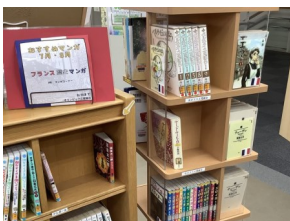
フランス歴史マンガ (マンガコーナー)