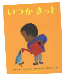
『いつかきっと』 アマンダ・ゴーマン(文) クリスチャン・ロビンソン(絵)