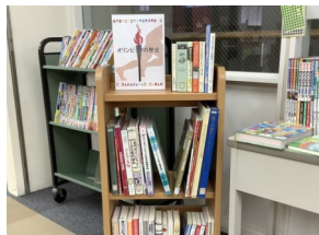
オリンピックの歴史 (2階階段横展示台)