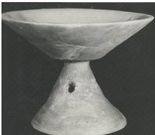
平尾遺跡の弥生土器