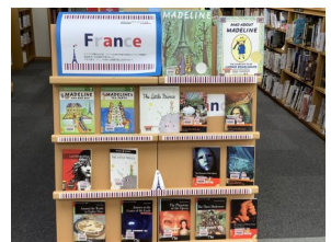
France (英語多読コーナー)