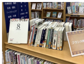
フランス映画を読む (一般書コーナー)