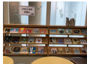
フランスのえほん (絵本コーナー)