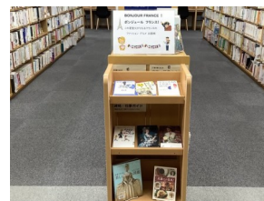
ボンジュール フランス！ (一般書コーナー)