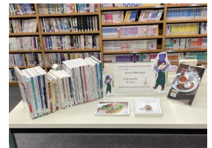
世界の料理を食べよう (家庭生活コーナー)