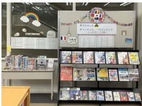
本で楽しむオリンピック・パラリンピック (2階階段横展示台)