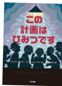
『この計画はひみつです』 ジョナ・ウィンター(文) ジャネット・ウィンター(絵) さくまゆみこ(訳) すずき出版

【連絡先】 多治見市図書館 22-1047 松田 090-8557-0827 今井 090-8671-1510 山口 090-7672-0531