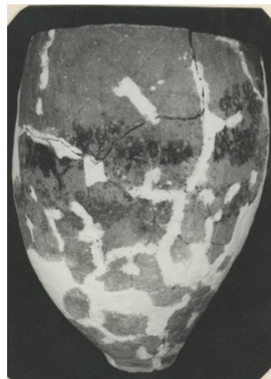
西坂遺跡の縄文土器