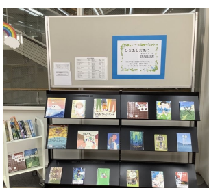
ひとあしお先に課題図書 (2階階段横展示台)