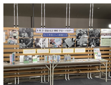
ALS/MMDグローバルデー (階段横展示台)