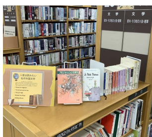
1度は読んでみたい名作外国文学 (外国文学コーナー)