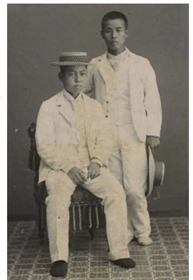
カンカン帽を被った男性と手に持つ男性

また、11月16日(土)には講座「タジミ学 Brilliant(ブリリアント)タジミ～絵図・写真で多治見をみる～」で、古い絵地図や写真を紹介します。明治・大正・昭和の時代、多治見に生きた人々の姿をぜひご覧ください。