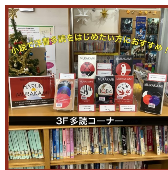
(英語多読コーナー)