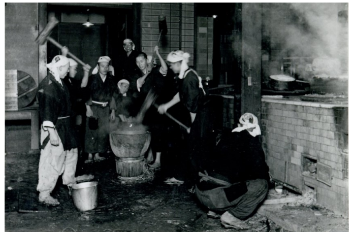
昭和20年代 永保寺の正月支度