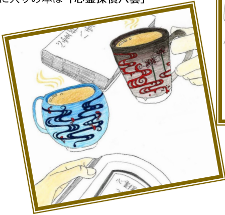
ハチさん お気に入りの本は「心霊探偵八雲」

他にも素敵なデザイン画をたくさんご応募いただきました。応募総数は38点、たくさんのご応募ありがとうございました！ここで一部を紹介させていただきます。これからも、「やくも」と一緒にみんなで多治見を盛り上げて行きましょう！