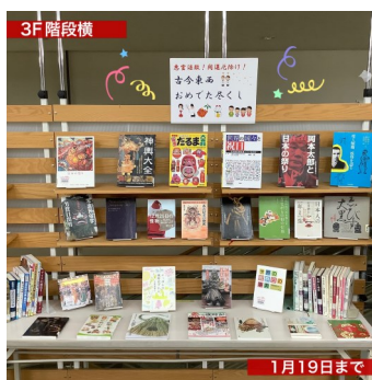
悪霊退散！開運厄除け！古今東西おめでた尽くし 英語で読む日本文学MURAKAMI HARUKI (3階階段横展示台)