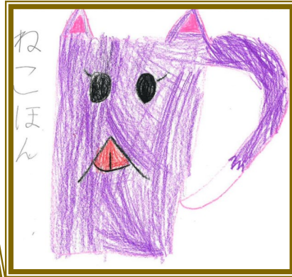
リーリーさん お気に入りの本は「ねこほん」