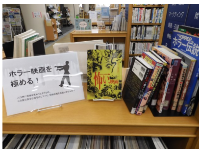
▲ホラー映画を極める！ (3階一般書コーナー)