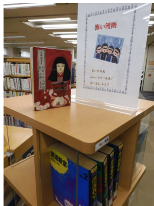
▲怖い漫画 (3階マンガコーナー)