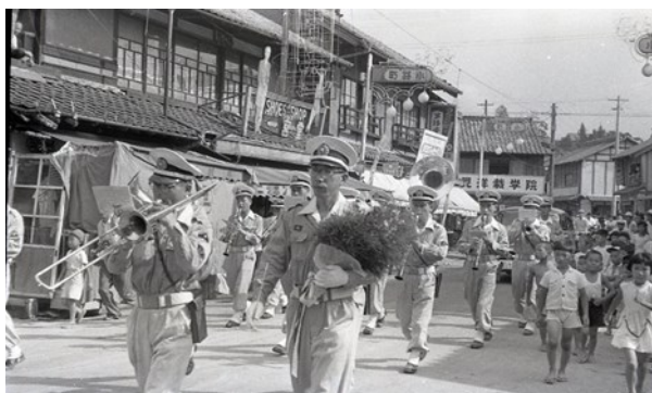
昭和31年(1956) 小路町 市制記念のパレード

残念ながら、今年の市制記念花火大会は中止となりましたが、かつての市制記念の催しの様子をご覧ください。