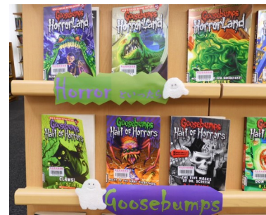
▲ホラーといったら Goosebumpsシリーズ (3階英語多読コーナー)