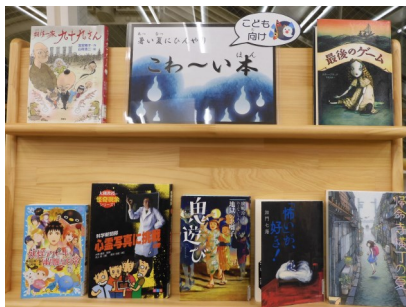
▲暑い夏にひんやり こわ〜い本 (2階児童書コーナー)

今年の夏も猛暑が予想されています。気分だけでも涼しさを味わってみませんか。 館内色々なコーナーで怖い本の展示を行っています。ぜひ手に取って体感してみてください。