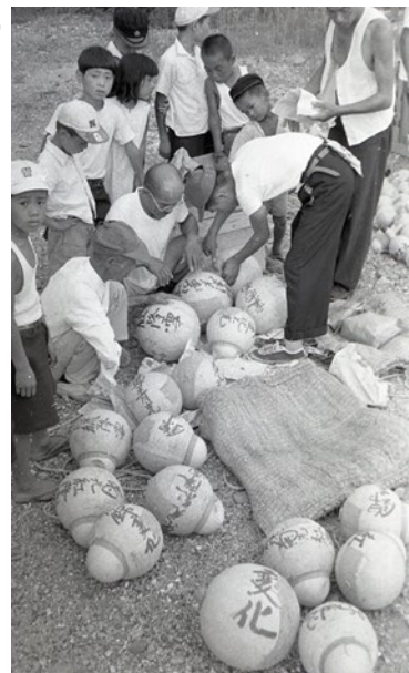
昭和31年(1956) 市制記念花火大会の準備 花火玉のそばに子どもたちが 群がっている