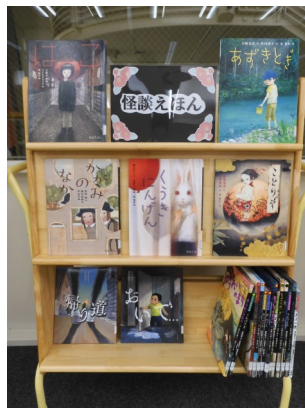
▲怪談えほん (2階児童書コーナー)