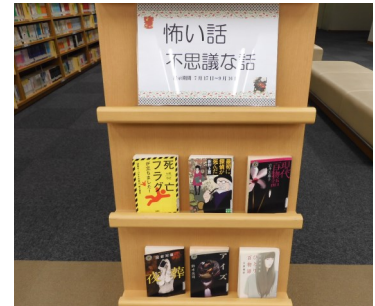
▲怖い話 不思議な話 (2階文庫コーナー)