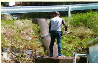
植栽・樹木の剪定作業