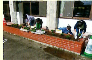
花苗の寄付と花苗植え