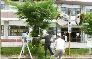
植栽・樹木の剪定作業