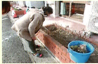
花壇の草取りと花苗の管理