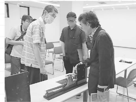
熱心に質問する参加者

まずは、アップライトピアノとグランドピアノの違いについて、実物のパーツを見比べながら説明がありました。展示室にはアップライトピアノとグランドピアノの鍵盤アクション※1が並べられていて、自由に触れて体験できるようになっていました。